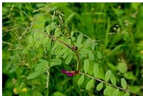
Detalle de la flor