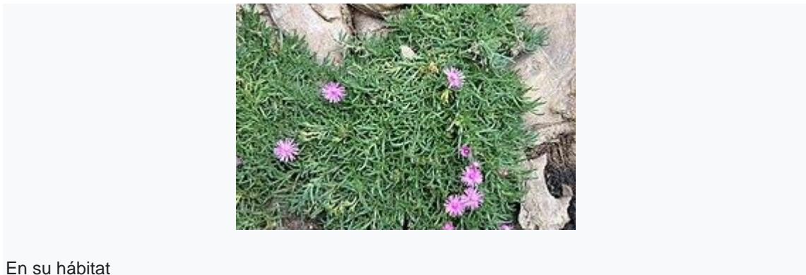
En su hábitat

Lampranthus spectabilis , es una especie de planta suculenta perteneciente a la familia de las aizoáceas. Es originaria de Sudáfrica.