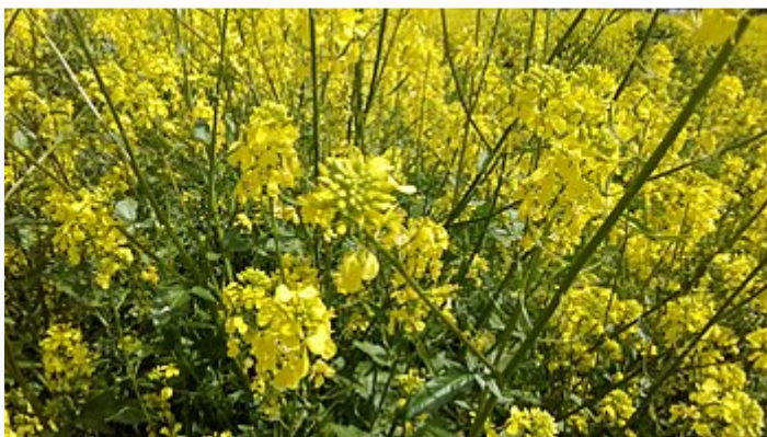
Jaramago amarillo ( Sisymbrium officinale )

Es una planta bienal muy parecida a la mostaza. Tallo erecto, ramificado, negruzco, rugoso y piloso que alcanza 25-60 cm de altura. Las hojas de la base son pinnadas con grandes lóbulos y márgenes dentados, las hojas superiores más pequeñas y menos lobadas. Las flores son amarillas y muy pequeñas, se agrupan en espigas terminales de hasta 50 cm de longitud. Los frutos son unas vainas (silicua) erectas adosadas al tallo que contienen semillas de color amarillo y sabor áspero.